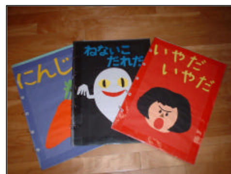
子育て支援センターの手作り絵本

子育て支援センター事業と保健医療センターを始めとした子育て類似事業の整理統合などを視点に評価を行いました。