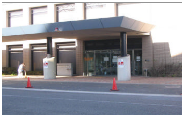
座間市休日急患センター(座間市緑ヶ丘1-1-3)

また、小児科においても、座間市、海老名市及び綾瀬市の共同で、平成15年4月から同センター内に小児救急患者センターを設置しております。