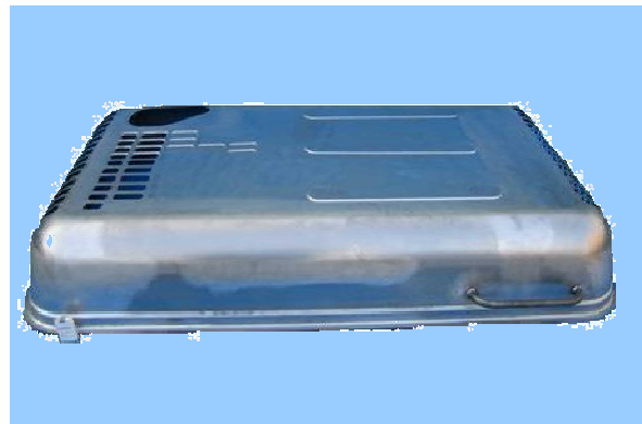
大型の建設機械部品まで製作