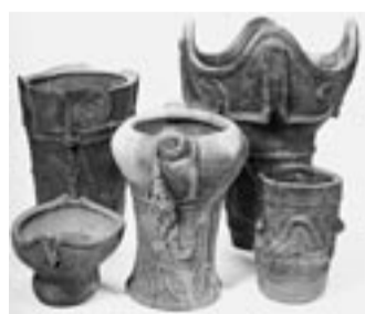
▲早川城跡出土土器