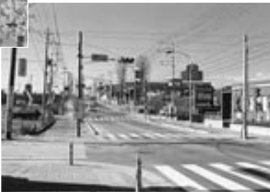
▲前庁舎付近の今と昔(左上)の写真