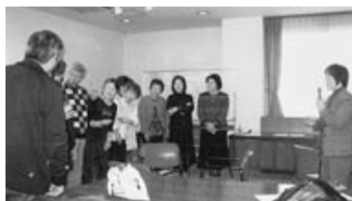
介護知識習得のため講習会に参加する会員たち

「より多くの人々が幸せな毎日を過ごせるように」と活動を続ける会員の皆さんと、その活動を支える家族の方々に敬服することも、ますますの活躍を期待したいと思います。