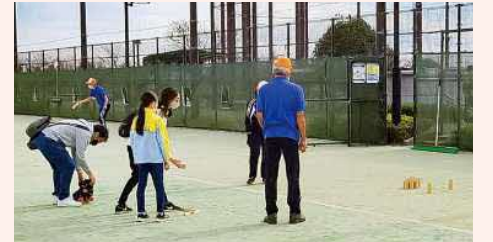
ねんりんピックでのモルック体験