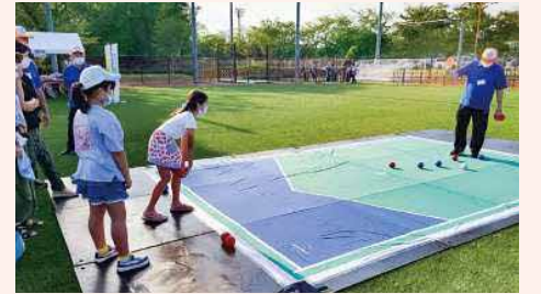
あやせ大納涼祭でのポッチャ体験

今年度は、パラリンピックの公式競技でもある「ポッチャ」の大会を自治会対抗で開催するなど、新たな取り組みも始めることができました。また、モルックなどのニュースポーツ体験会を実施している他、自治会や子ども会行事への指導者の派遣も行っています。ぜひ多くの方にスポーツの楽しさを体験していただき、運動を始めるきっかけになってほしいと思います。