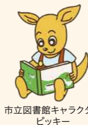
市立図書館キャラクター ピッキー

時4月24日(月)10時30分～11時30分場図書館対0～3歳児と保護者、プレママ・プレパパ定5組(申込順)申4月2日9時から同館へ電話か直接