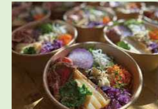
あやせのロケ弁一例