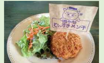
あやせとんすきメンチ