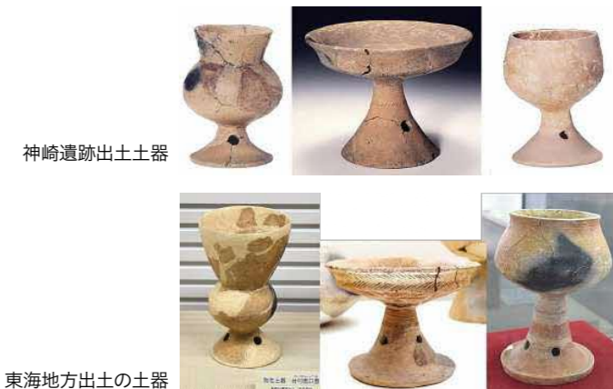
神崎遺跡出土土器