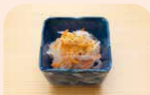
ピーナツ入り 紅白なます

昔の綾瀬の農家で食べられていたごはんです。米をたくさん食べられなかった時代、採れた農作物でかさを出し、野菜のうまみでおいしく食べる工夫をしていました。