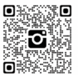
市消防本部公式インスタグラム