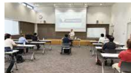
創業スクールの様子

▶支援内容 株式会社を設立する際、登記にかかる登録免許税の軽減や、創業2カ月前から対象となる無担保、第三者保証人なしの創業関連保証の特例を事業開始6カ月前から利用できるなど