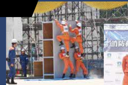
関東大会に出場した障害突破チーム