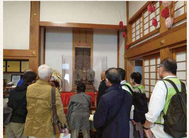
一塔両尊像(大法寺境内の様子)

同像が造られてから今に至るまで、大法寺は幾度も火災の被害に遭っています。それでも同像が残っているのは、都度お寺の関係者や地域の人々が守ってきたからだと考えられ、同像が重要な仏像だったことがわかります。