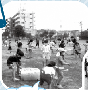
綾北プラザでは、水鉄砲と水風船で遊んだよ!

夏休み期間中に実施しています。全5日間の日程のうち、1日はお楽しみイベントとして各プラザで催し物を開催しています。夏祭りを模したヨーヨーすくいやかき氷、水鉄砲、水風船といった夏ならではの涼しい遊びなどを企画しています。