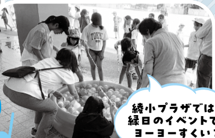
綾小プラザでは、緑日のイベントで、ヨーヨーすくいをしたよ!