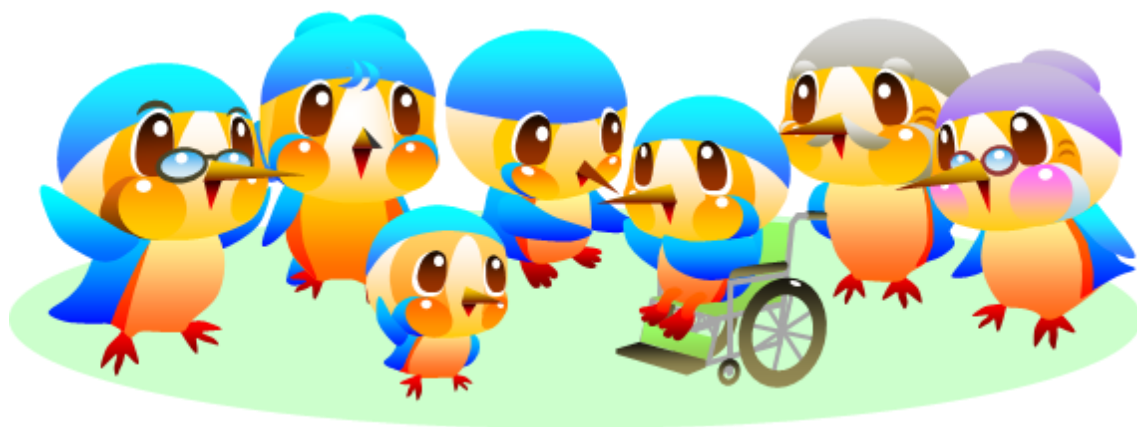
綾瀬市マスコットキャラクター あやびい