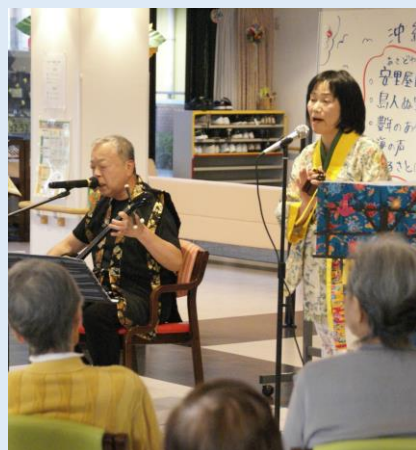
島村さんご夫妻（大上在住）

拙い演奏ですが、皆さん喜んでくださいますし、一緒に楽しむことができ、私たちの励みになりました。今ではボランティアをさせていただいていることに感謝しています。