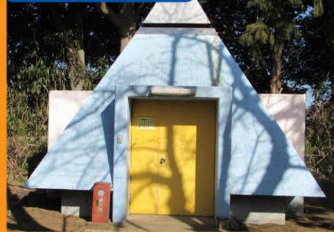
吉岡地区センター