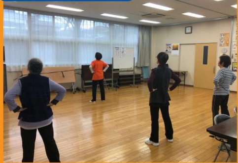
綾西高齢者憩の家