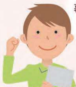
主任ケアマネジャー