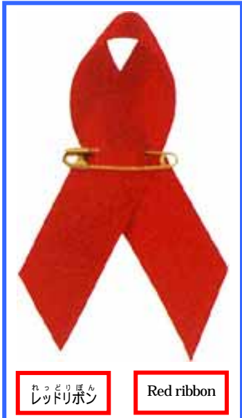
れどりぼん Red ribbon

・ Kanagawa Prefecture provides HIV tests with translators. (English, Protégées, Spanish, Thai translators are available.) The results are given on the same day as the tests. ・ You do not have to ask for a translator ahead of time. Tests are free of charge. You can take the test anonymously, and your privacy is protected.