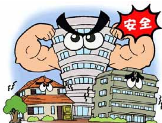
耐震構造(たいしんこうぞう)の新しいビルなどは、比較的安全なため、落ち着いて行動する。

Actuar con Serenidad y Calma. Los edificios de ahora relativamente son seguros. No apurarse. Actuar con Serenidad.