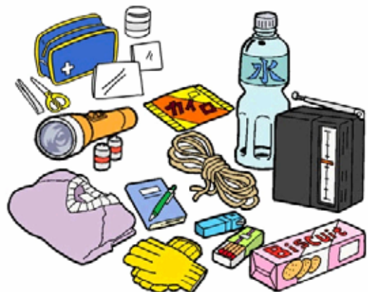
地震に備える非常用品は、緊急避難のとき持って逃げる、「非常持出品」と、地震後の生活を支える「非常備蓄品」に分けて備える。

Preparar una bolsa con cosas necesarias para escapar del terremoto. Y preparar cosas para vivir despues del terremoto.