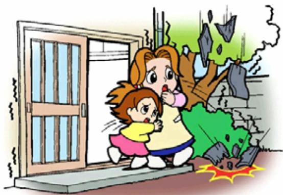
あわてて外に飛び出すとガラスや屋根瓦(やねがわら)などが落ちてきて大変危険。まわりの状況をよく見て行動。

Asegurar una Salida. Hay casos que no podra abrir la puerta por la deformacion del edificio.Para asegurar una salida,utilizar una silla y dejar abierta la puerta.