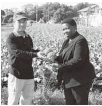
古矢さんの畑で特産のプロッコリーを手に

11月5日、サロメ・シジャオナ駐日特命全權大使が市内2戸の農家の視察と市長を表敬訪問しました。これは、かねてから大使と親交のあった市内の農家への訪問に伴い実現したものです。