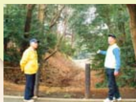
▲城跡の土塁・掘切

渋谷氏は秩父平氏の流れをくむ一族ですが、1159年に平清盛が源義朝に勝利した平治の乱以降は平氏方に立ちつつも、敗れて流浪した源氏一族の佐々木秀義を保護しました。源頼朝が挙兵すると平氏勢力追放に助力し、結果的には鎌倉幕府成立とともに有力御家人の一員となりました。市内には、関連する遺跡がいくつか見られますが、渋谷氏の城といわれる早川城跡は現在、城山公園として市民の憩いの場になっています。