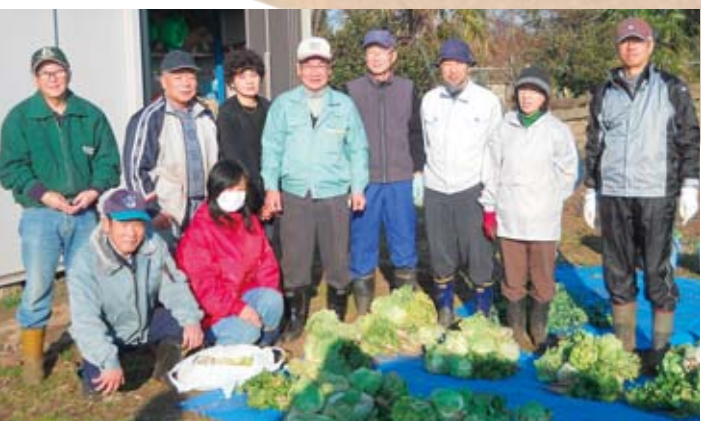
▲援農ボランティア養成講座参加者

研修は3年間、原則として毎月第1・3水曜日の13時30分から、市内の農地で行います。1年目は農業の基本を、2年目は実習生と