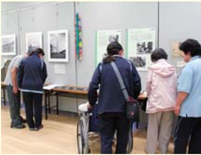
▶ 昨年の平和展の様子

6月27日(月)～7月3日(日)、市役所7階市民展示ホールで開催する平和展の展示品を募集します。