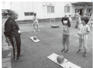
▲昨年のわいわいプラザの様子

8月22日(月)~26日(金)、市内小学校施設の一部を夏休み期間中に開放する「わいわいプラザ」で、ボランティアかアルバイトとして協力してくれる大学生を、次のとおり募集します。同プラザは、子どもたちの安全な遊び場を確保するために行