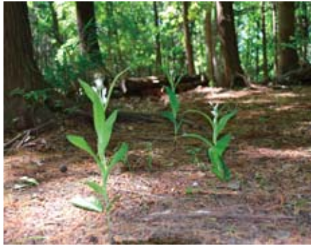
市内の森に自生するキンラン(写真上)、ギンラン(写真下)