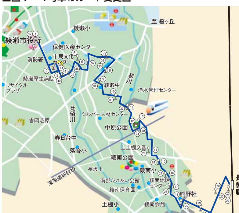
■図1 4号車のルート変更図