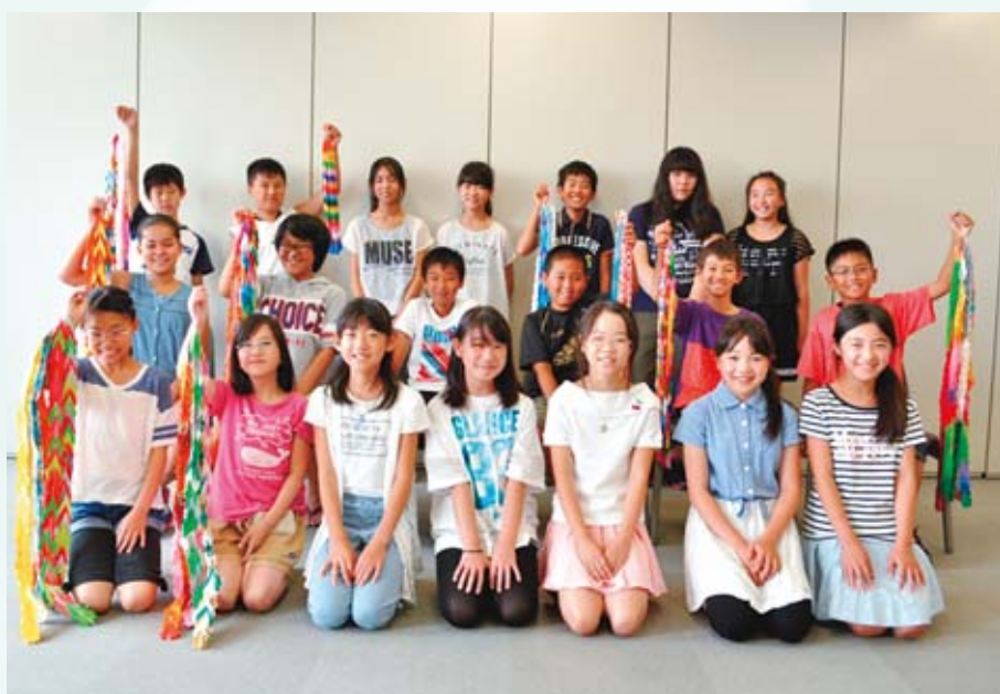
▲あやせっ子平和学習生