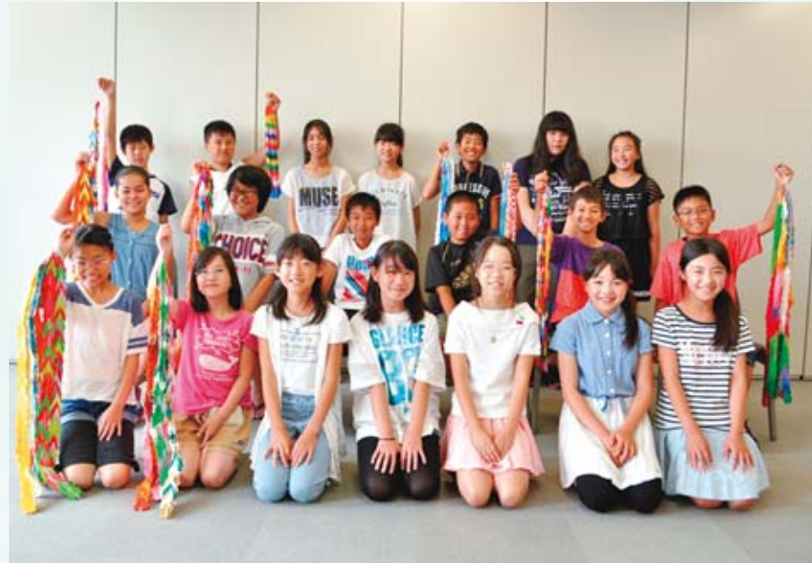
▲あやせっ子平和学習生