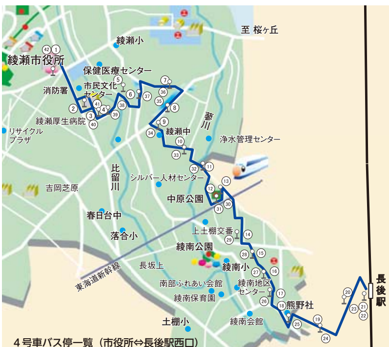
4号車バス停一覧(市役所⇄長後駅西口)