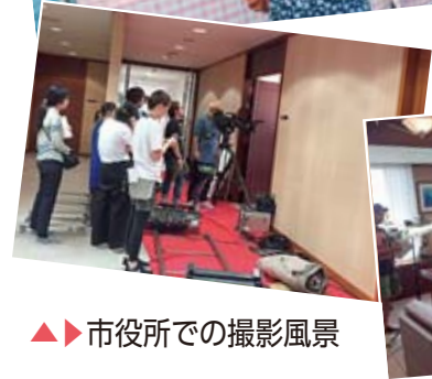
▲市役所での撮影風景

市内在住・在勤・在学で高校生以上の方対象。定員150人(抽選)。国綾瀬ロケーションサービス、市商工会。申込「綾瀬ロケーションサービスシンポジウム参加申込」と明記の上、住所・氏名・年齢・電話番号を、12月28日までに商業観光課(〒70-5700、SUMI