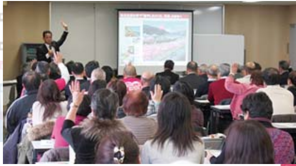
▲過去の同シンポジウムの様子