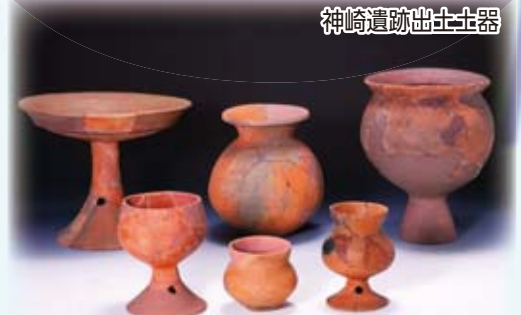
神崎遺跡出土土器