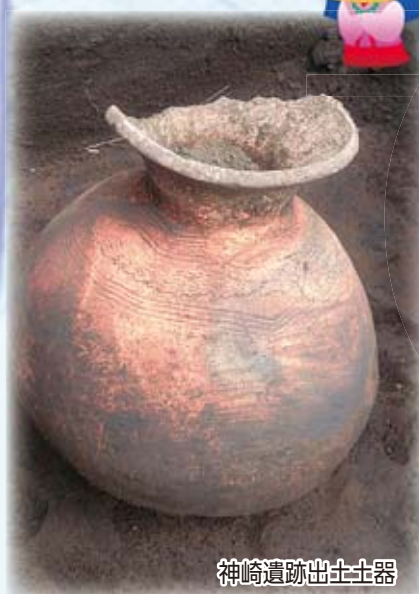
神崎遺跡出土土器

☎2月2日から同館 ☎77・0841。 ※駐車場に限りがあるので、公共交通機関を利用してください