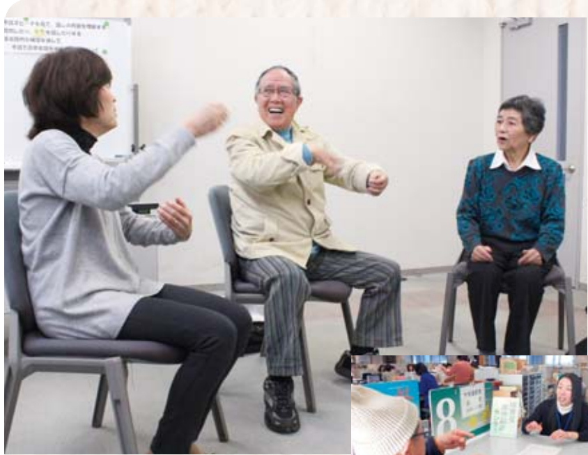
▲奉仕員養成講座の様子

聴覚障がい者にとって、通院や学校での懇談会、公的機関の手続きなど、社会生活の中で不便を感じる場面が多くあります。市では、市役所窓口への手話通訳者の設置や聴覚障がい者の依頼による手話通訳者の派遣を行っています。現在、国認定の通訳士4人と県認定の通訳者4人、市登録奉仕員1人の計9人が登録し、窓口や派遣に対応していますが、一部市外の方に協力を依頼していることから、市内在住の手話奉仕員や手話通訳者の養成に努めています。聴覚に障がいのある方にとってコミュニケーション方法の一つである手話を、多くの方に学んでもらい、普及させることが理想です。