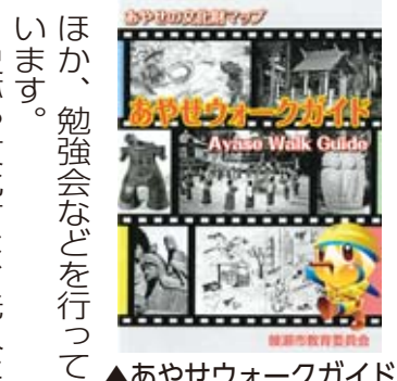
▲あやせウォークガイド

同ウォークガイドは、文化財巡りを楽しむためのコースを紹介した小冊子です。早川城跡や五社神社などを巡る「渋谷氏コース」、神崎遺跡や吉岡遺跡群などを巡る「古代遺跡コース」など、市内全9コースのル