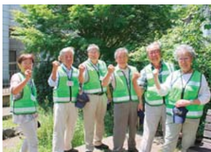
▲史跡ガイドボランティアの皆さん

受講者が修了後に史跡ガイドとして活動するため、見学会と座学を通じて知識やノウハウなどを習得します。各回13時30分～16時の全8回で、内容などは上の表のとおりです。歩きやすい服装と運動靴を着用し、飲み物、筆記用具持参。定員20人(申込順)。☎8月2日9時から生涯学習課 ☎70・5637。 同講座の受講者は、修了後に市史跡ガイドボランティアの会に入会し、会員として実際の案内活動などを行います。同会は、同ウォークガイドのコース案内の