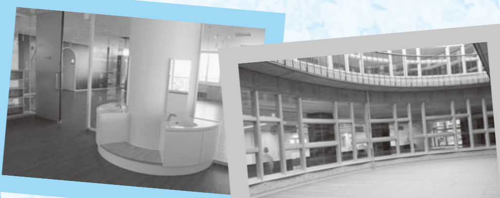
▲子ども用の手洗い場もある子育て支援センター