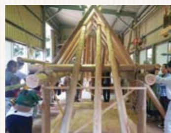
▲古代住居の骨組み

約1800年前に作られた環濠の実物を掘り返して行う公開は、全国で例がなく、大変貴重なものです。 遺跡保存の観点から常時公開は難しく、1年でこの2日間のみ公開になります。ぜひ、この機会にご覧ください。