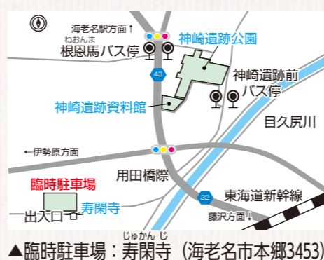
▲臨時駐車場：寿閑寺 (海老名市本郷3453)

環濠は同公園内に埋め戻されていますが、整備に伴い、過去に調査した環濠の一部(4m×2m)に不織布や保護材を敷き詰め、その上から防水シートなどで覆うことによって、カビなどの発生を防ぐよう保護しています。 約1800年前に作られた環濠の実物を掘り返して行う公開は、全国で例がなく、大変貴重なものです。 遺跡保存の観点から常時公開は難しく、1年でこの2日間のみ公開になります。ぜひ、この機会にご覧ください。