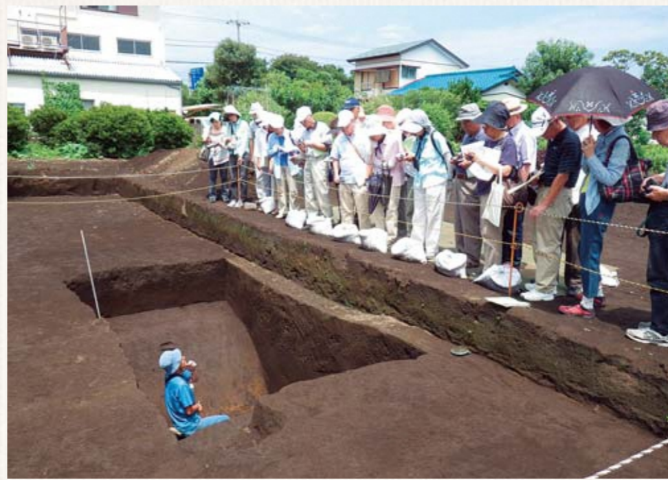
▲平成25年度の発掘調査報告会の様子

神崎遺跡の環濠公開 11月3日(金・祝)・4日(土)9時～15時、神崎遺跡公園で国指定史跡・神崎遺跡の環濠の一部を一般公開します(荒天中止)。12時～13時を除く時間帯で、30分ごとに職員による説明を行います。 併せて、古代住居組み立て体験教室で使用する、仮設型の弥生時代の復元住居の見本を展示するほか、隣