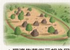
▲環濠集落復元想像図

神崎遺跡にまつわるさまざまな催しを開催します。 この機会に、古代の生活や文化に思いをはせてみませんか。 園生涯学習課 ☎70・5637。