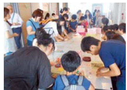
▲千羽鶴作成コーナー

6月30日(土)、同会場に千羽鶴作成コーナーを設けます。作製した千羽鶴は、小学生広島派遣事業「あやせつ子平和学習生」の児童20人が平和への思いを込め、広島平和記念公園へ届けます。市役所へお越しの際は、折り鶴の作製に協力してください。