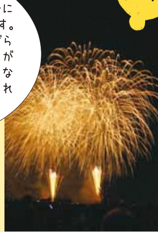
綾瀬市商工会青年部花火大会

夏に開催される花火大会には、妻と足を運んでいます。畑の真ん中から打ち上げられるので近くで見ることができて、最後の一番大きな花火は、視界全体が覆われるほど迫力があります。