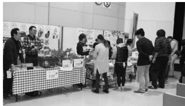
あやともまつりでの販売の様子