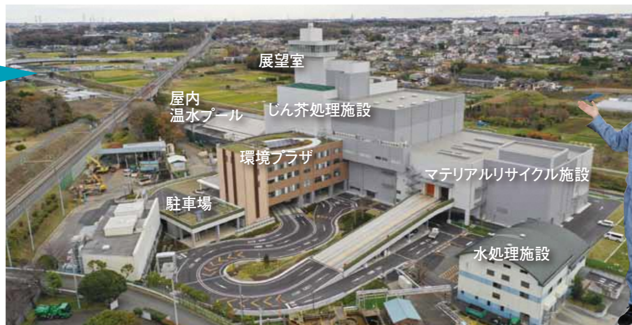
上空から見た施設の外觀

ごみピット 1万1000㎡(およそ9日分)の貯留が可能で、旧施設の約4倍となっています。