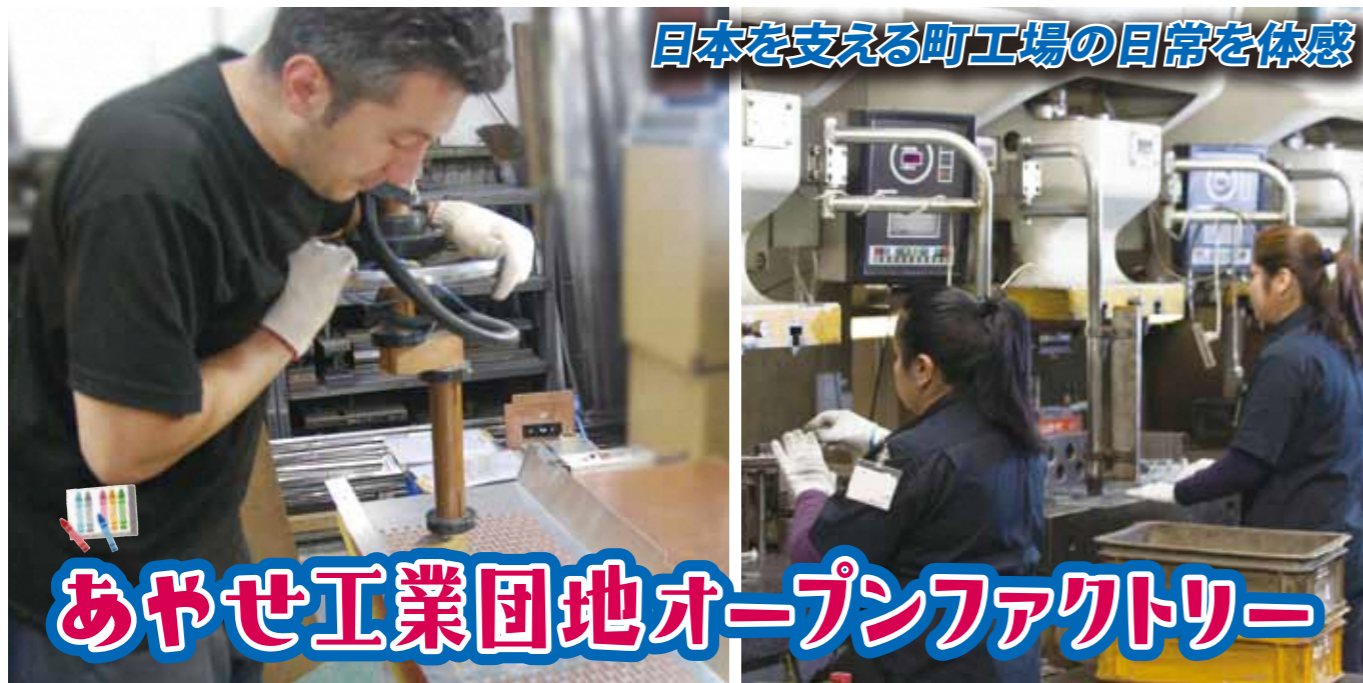
日本を支える町工場の日常を体感