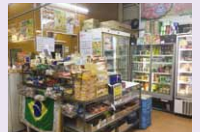
市内のブラジル食品店

日本各地にはブラジルにルーツのある方が多く暮らす、ブラジリアンタウンがあります。市内にも食品工場や飲食店などがあり、現地の商品や料理をとおして、日本にいなながらブラジルの文化にふれることができます。