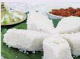
縁起物のキリバット