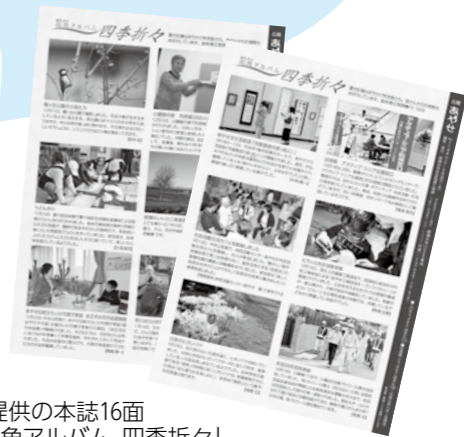
「まち特」提供の本誌16面掲載の「街角アルバム 四季折々」