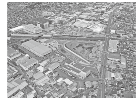
同インターチェンジの工事をしている様子

来年夏ごろの開通を目指し事業を進めている、スマートインターチェンジの正式名称が「綾瀬スマートインターチェンジ」に決定しました。この名称は、「(仮称)綾瀬スマートインターチェンジ地区協議会」で名称原案を策定し、(独)日本高速道路保有・債務返済機構が決定しました。▶インテナー推進室☎70・5681