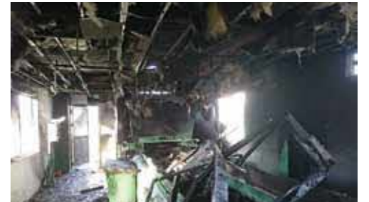
リチウムイオン電池の発火が原因で起きた実際の火災現場