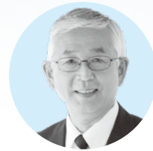
綾瀬市長 古塩 政由

ご自身や大切な人を守るため、さらには綾瀬市の未来のためにも、市民の皆さまと行政が一体となりこの事態を乗り越えていきましょう。