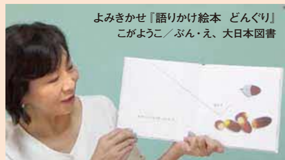
よみきかせ『語りかけ絵本 どんぐり』 こがようこ/ぶん・え、大日本図書