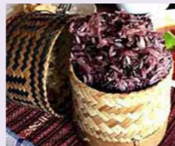
もち米のなかでも最高級とされる色米