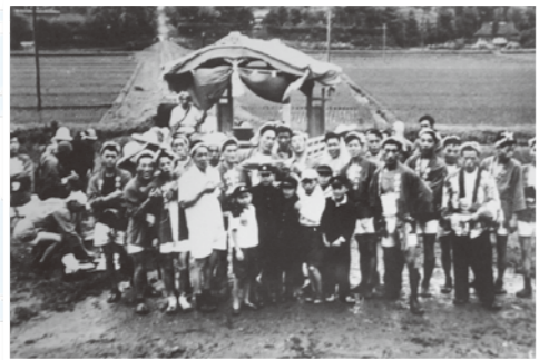
昭和29年 吉岡の堀之内橋付近にある山王社の夏祭り

併せて、同課では、同事業を推進するため、動画を公開しています。動画は湘南工科大学の協力により作