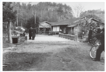
昭和35年 早川の武者寄橋付近