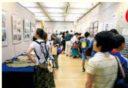
令和元年の平和展