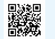
SC相模原 広報部 ホームタウン担当 ガミティ

齢者医療広域連合へ郵送、FAX 045・441・1500か直接、保険年金課へ直接、電子メールに氏名、住所、年齢、意見などを明記して提出 MAIL pubcomm@union.kanagawa.lg.jp 同広域連合☎045・440・6714、保険年金課☎70・5617 ●綾瀬市パートナーシップ宣誓制度(案)への意見 ▶期間 10月6日~11月4日 ▶閲覧・配布場所 市民課行政資料コーナー、