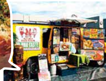
ハワイアンフードトラックH&H