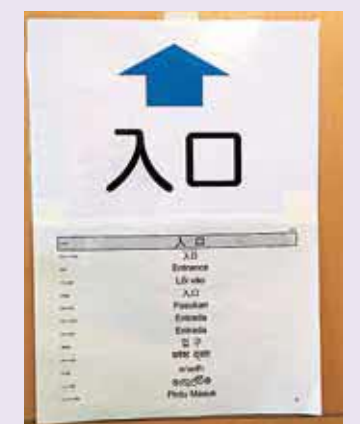
新型コロナワクチン接種会場の案内表示