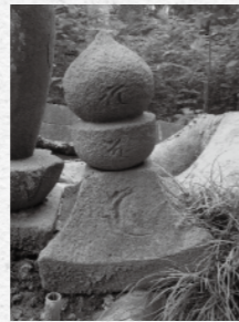
鎌倉末～南北朝の特徴をもつ空風輪と火輪(市内最古級)

本蓼川を除く市内各地にあり、合計195個が確認されています。全てバラバラになっており、残念ながら当初の姿を残すものはありませんが、嘉暦4年(1329年)の年号が確認できる地輪が1点あり、鎌倉時代末期には市内で造立されていたことが分かります。他にも、鎌倉時代末期から南北朝時代前期に造立された古東海道の空輪や小園地藏堂脇の水輪、個人墓地の空風輪などがありますが、大半は室町時