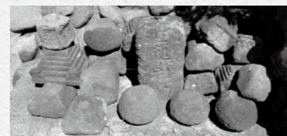
寺尾の道祖神。中央の丸い石が水輪