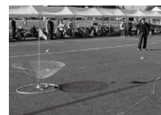
リハーサル大会の様子

全国健康福祉祭(愛称:ねんりんピック)は、スポーツや文化種目の交流大会をはじめとした、健康や福祉に関する多彩なイベントです。主に60歳以上の高齢者を中心とする国民の健康保持・増進、社会参加、生きがいの高揚を図り、ふれあいと活力ある長寿社会の形成に寄与するため、昭和63年から毎年開催しています。来年11月のねんりんピックは、県内26市町で32種目のスポーツや文化種目をはじめ、子どもから高齢の方まで楽しめるイベントも多数開催する予定です。