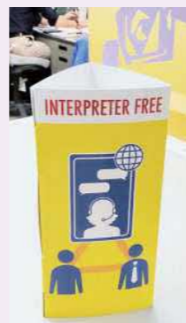
市役所窓口を設置する三角ポップ