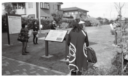
令和3年度の見学会の様子

神崎遺跡や同遺跡から出土した土器などについて、学芸員による解説付きの見学会を実施します。同遺跡の特徴や、最近の研究成果について学びます。 ▶時間 ①9時5分~9時50分 ②15時30分~16時15分 ▶定 各回40人(申込順)