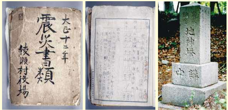
綾瀬村役場-震災書類-(表紙) 綾瀬村役場-震災書類- 震災を記録した石造物(深谷神社)

時 8月4日(金)～26日(土) 9時～16時(4日は13時から、26日は12時まで。6日・11日・13日は休み) 場 市役所7階市民展示ホール