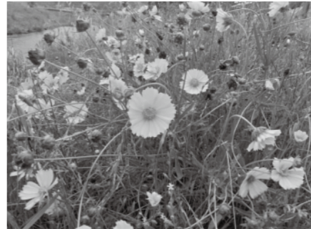
一重咲きのオオキンケイギク