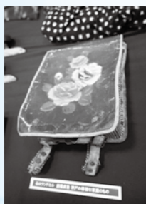
当時使用していた布のランドセル