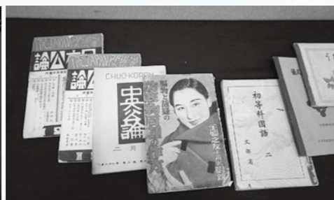
市民からの借用書籍